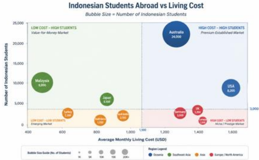
รูปที่ ๔ นักศึกษาอินโดนีเซียในต่างประเทศเทียบกับค่าครองชีพ (มุมมองแบบ Quadrant)

ในกลุ่มประเทศปลายทางระดับโลก อย่างสหรัฐอเมริกาและออสเตรเลีย มีลักษณะที่เหมือนกันคือเป็นประเทศค่าครองชีพค่อนข้างสูง แต่ยังคงได้รับความนิยมจากนักศึกษาเป็นจำนวนมาก ความนิยมอย่างต่อเนื่องนี้สะท้อนว่านักศึกษาอินโดนีเซียยินดีที่จะรับภาระค่าใช้จ่ายที่สูงขึ้นหากประเทศจุดหมายปลายทางนั้นสามารถมอบคุณภาพการศึกษาและการยอมรับในระดับสากล รวมถึงโอกาสด้านการจ้างงานและคุณค่าต่อเส้นทางอาชีพระยะยาวได้อย่างชัดเจน ในบรรดาประเทศเหล่านี้ประเทศออสเตรเลียถือเป็นประเทศที่โดดเด่นเนื่องจากยังคงรักษาระดับความต้องการของนักศึกษาได้สูง ถึงแม้ว่าจะมีต้นทุนโดยรวมที่สูงกว่าหลายประเทศซึ่งสะท้อนถึงความสมดุลที่แข็งแกร่งระหว่างคุณภาพหรือการเข้าถึงและผลตอบแทนจากการลงทุนด้านการศึกษา